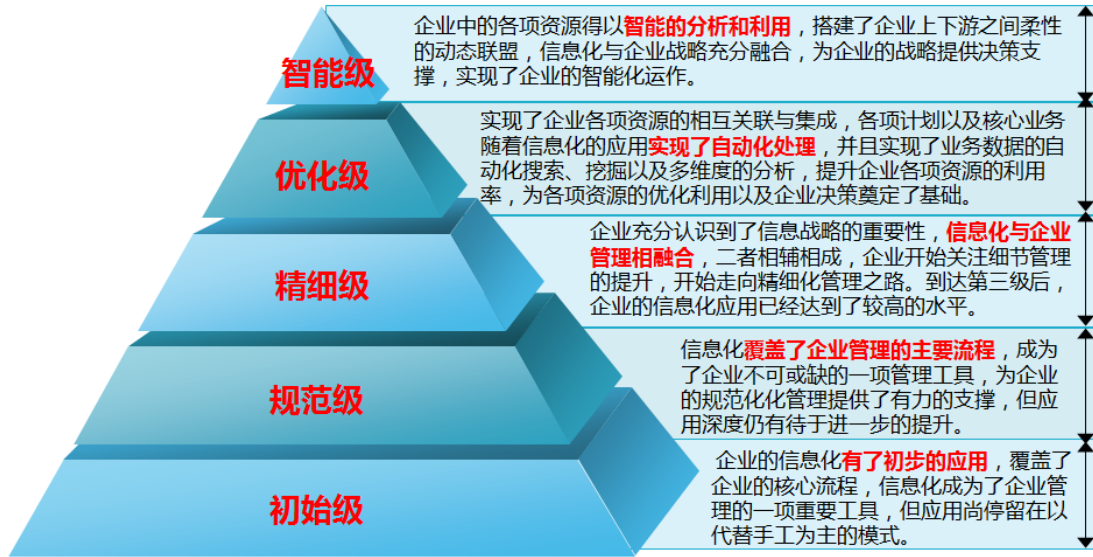
e-works 制造业信息化评估体系